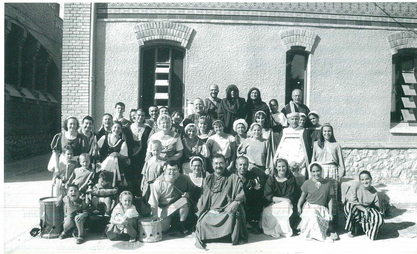
Festa del Renaixement a Tortosa. Participants del CCR, Colla Gegantera i Grallers d'Ulldecona