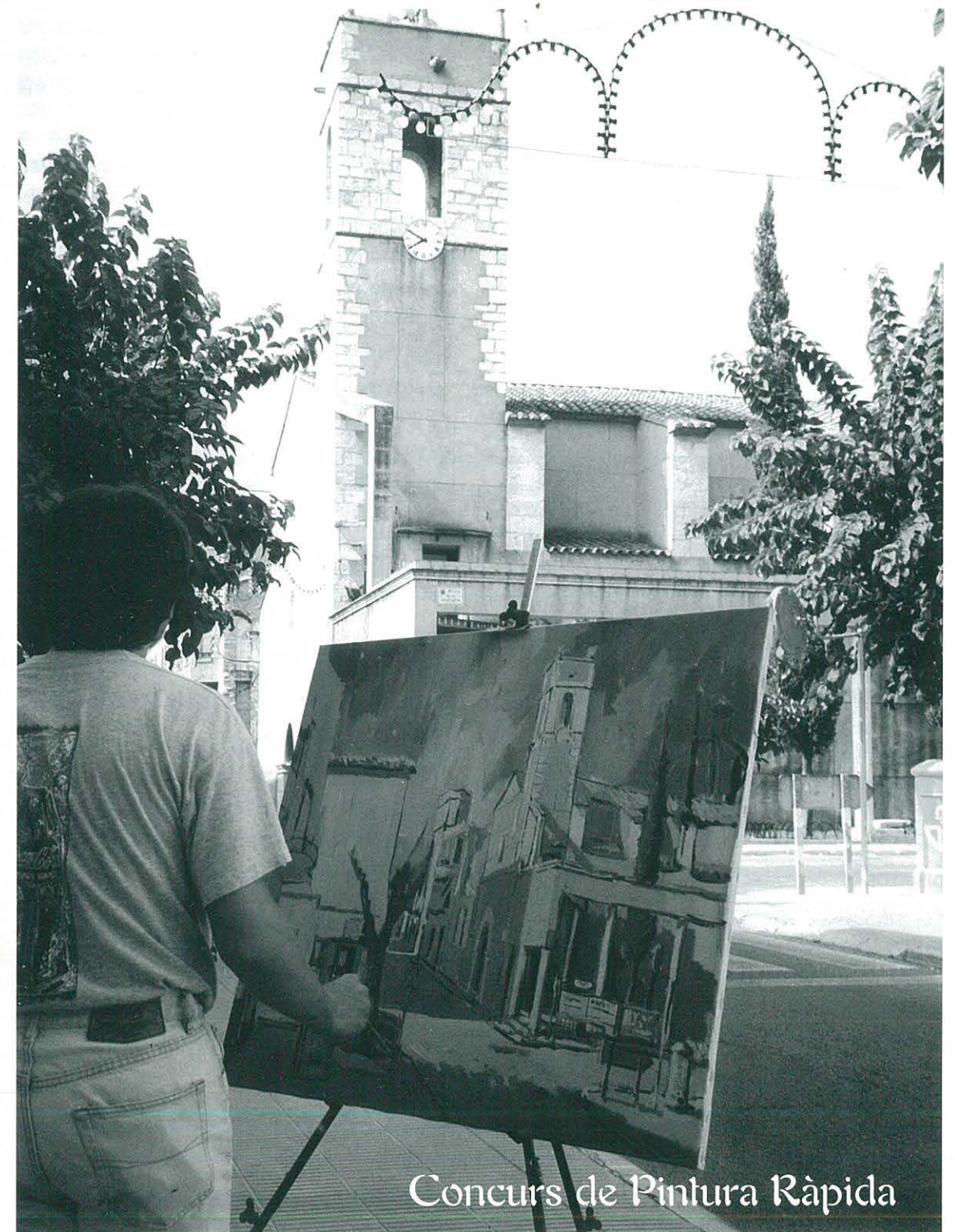
Concurs de Pintura Ràpida